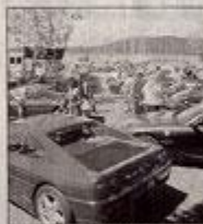
De belles carrosseries qui en ont fait rêver plus d'un.

La rencontre des F1 des mers et des bolides de la route, organisée par l'association Offshore Passion, a "fait un tabac". Les cabriolets, coupés, spiders, du plus célèbre des constructeurs italiens ont ébloui les amateurs. 512 TR, 360 Modena, des anciennes comme la Mondial 1987, des récentes comme le tout dernier modèle de la F 430 mais également une 575 M Super America, modèle très rare car fabriqué en série limitée, qu'elles soient rouges, jaunes,