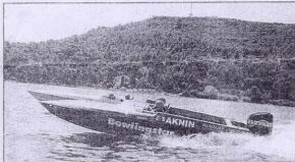
► La compétition de Offshores, les "Formule 1 des mers" va assurer le spectacle.

A u cours de ce long week-end, impossible de s'ennuyer. Tour d'horizon de ce qu'il y a à faire et à voir.