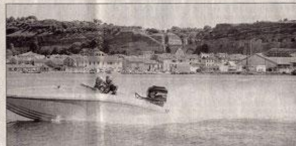
Les courses d'offshore ne sont plus réservées aux hommes. Cette année à Saint-Chamas, trois équipages 100 % féminins étaient en lice dont celui de Valérie Tavan sur Crazy Girls!

Pendant deux jours, la baie de Saint-Chamas a vrombi au rythme des monstres des mers en lice pour le championnat de France d'offshore, organisé par Offshore Passion. Installés sur les berges engazonnées de l'étang, les spectateurs étaient aux premières loges. Sept catégories